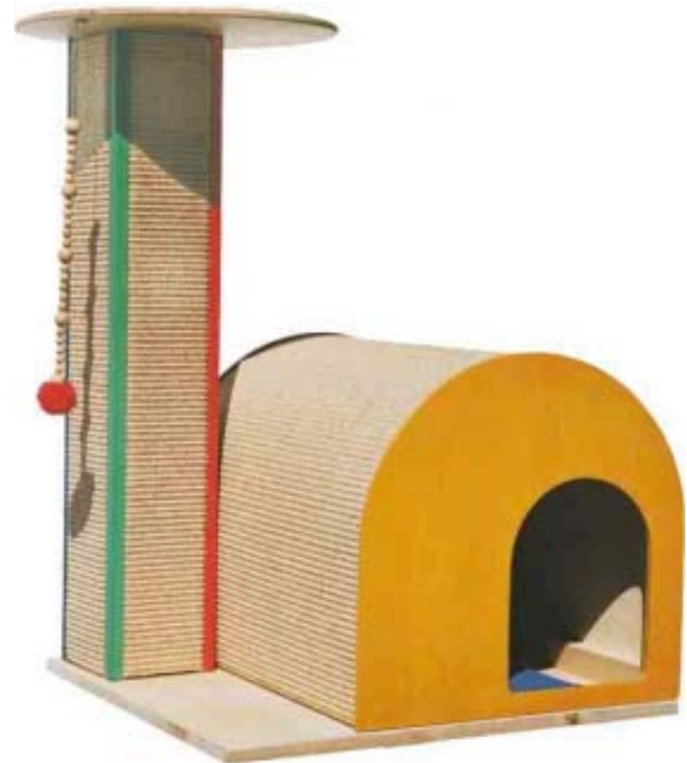
Casa mit Zusatzausstattung