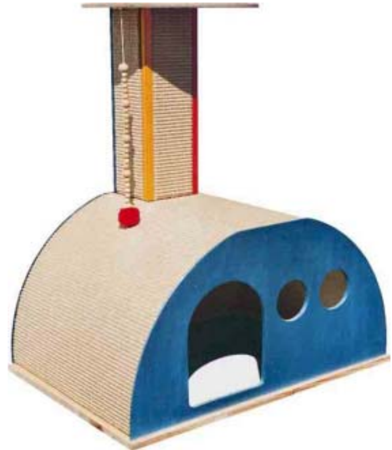
Sondermodell mit Sitzfläche